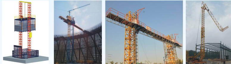
双导柱双桅塔 多功能Многофункциональный 施工平台桅塔альный альпинист 快架塔 самоуставляющийся башенный кран

备注Примечание: 1.可定制,尤其专业非标设计制造Можно настроить, особенно профессионально для нестандартного дизайна и производства. 2.EAC,CE证书,国家标准制定者。EAC,CE сертификат,Установщик национальных стандартов.