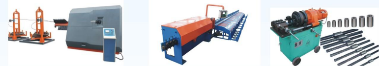
弯箍机машина для гибки арматурных хомутов 调直切断机 машина для правки и резки арматуры 钢筋连接сращивание арматуры

备注Примечание: 我们还有其他钢筋加工机械。请咨询我们的销售经理了解更多详情。У нас также есть другое оборудование для обработки стальных прутков. Пожалуйста, проконсультируйтесь с нашим менеджером по предложениям для получения более подробной информации.