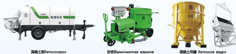
混凝土泵бетонасос 砂浆机минометная машина 混凝土吊罐 бетонное ведро

备注Примечание: 移动式мобильный HGY13/15/17/21; 楼板式爬墙 по полу HGY17/21/24/28/32/33; 电梯井式лифт-альпинизм HGY21/24/28/32/33; 固定式stationарный HGY17/19/21/24/28/32/33; 框架式опалубка HGY15/17/21/24/28/32/33.