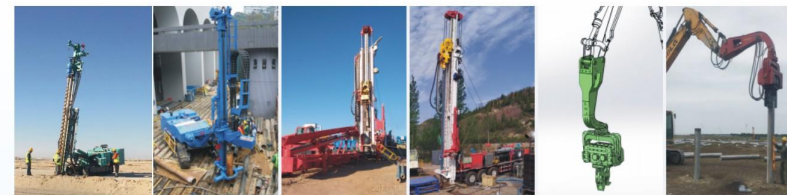
履带式钻机Гусеничные буровые установки 煤层气钻机 буровые установки для добычи угольного метанаса 液振振动锤Гидравлический вибротолот

备注Примечание: 履带式钻机Гусеничные буровые установки JD110/180; 煤层气钻机буровые установки для добычи угольного метанаса ZTH5421TZ10/45; ZTH5531TZ15/600; ZTH5631TZ20/900; 液振振动锤гидравлический вибротолот JV400, JV500, JVC70.