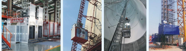
普通施工升降机Строительный подъемник 斜梯наклонный тип 工业电梯промышленный тип 货梯материала